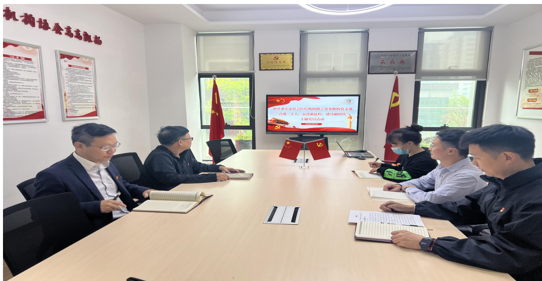
（重庆市社会医疗机构协会办事机构党支部主题党日活动）

2022年10月16日上午，中共重庆市社会医疗机构协会办事机构支部委员会（以下简称：办事机构党支部）召开“喜迎二十大，奋进新征程、建功新时代”主题党日活动（以下简称：主题党日）。